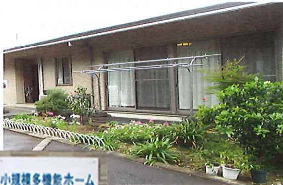
小規模多機能ホーム みなみだいら

利用者お一人おひとりの状況に合わせて、 住み慣れた場所で、最後までその人らしく 生活ができるように支援させていただきます。